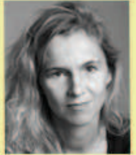
Delphine de Vigan